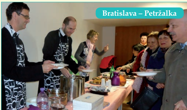
Bratislava – Petržalka

Podvečer v Novom Meste nad Váhom realizovali podujatie PODELME SA! na spoločnom stretnutí pri sladkom pohostení.