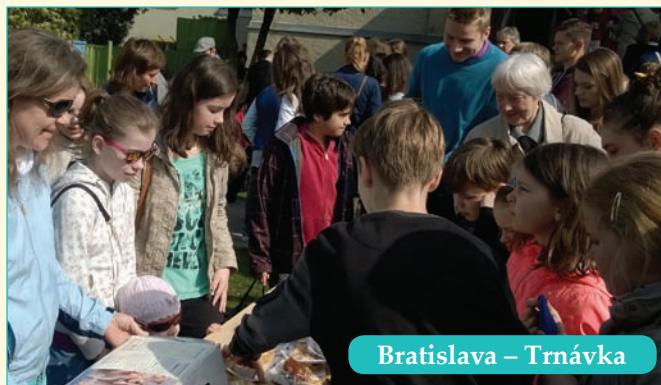
Bratislava – Trnávka

Solidaritu fungujúcich rodín s tými, ktorí toto šťastie nemajú, reprezentuje aj krásna mladá rodina z Horných Orešian.