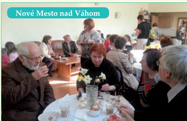
Nové Mesto nad Váhom

V Sereďi opäť navarili výbornú „pôstnu polievku“ a za krásneho slnečného počasia sa zúčastnilo viac ako tristo ľudí dobrej vôle.