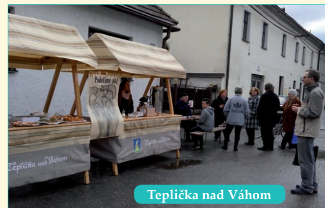
Teplička nad Váhom